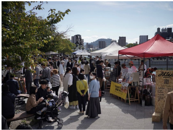
猿猴川の水辺活用社会実験「みんなのMARKET」

「広島駅周辺地区まちづくり協議会」の事務局運営に対する助言・サポートを行うとともに、同協議会の事業に関する企画・実施・効果検証等の業務を受託しました。