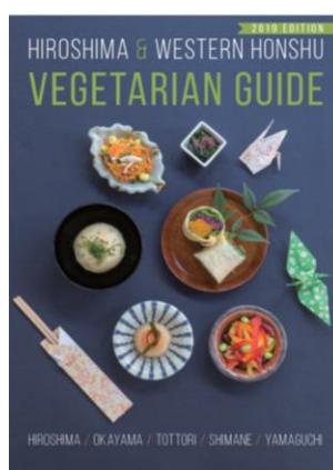
2019年版ベジタリアンマップ