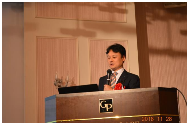
大土井様の発表状況