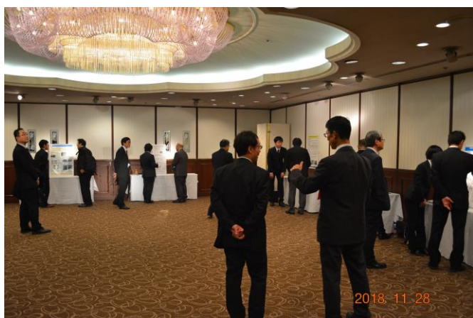
ポスターセッション開催状況

最初に「1分間プレゼン」として、ポスターにより伝えたいことを1分間にまとめて発表いただきました。